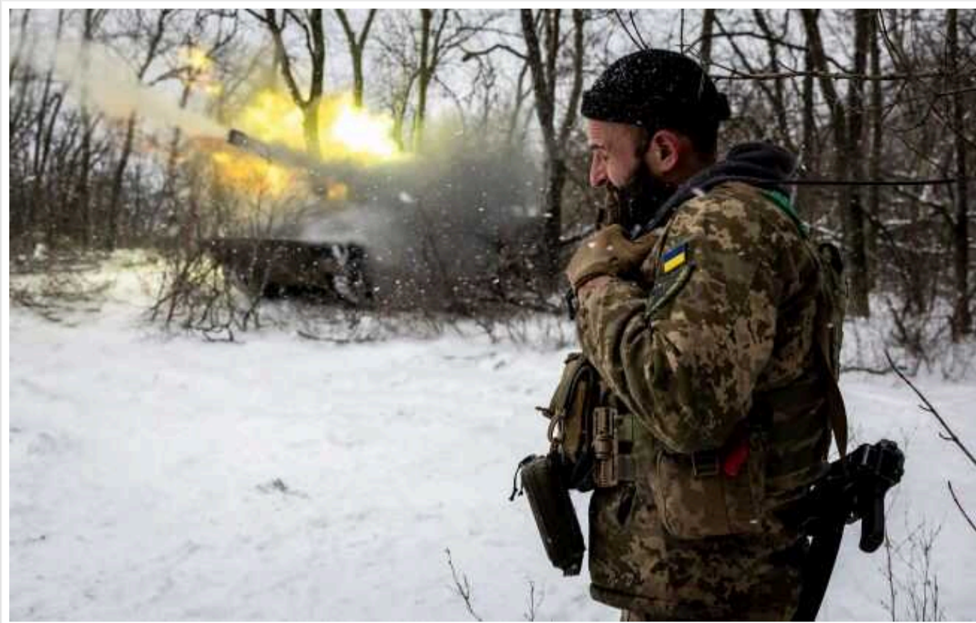
ЗСУ поставили "жирний хрест" на потенціалі залізниці з Росії у Гранітному на Донеччині: захисники завдали чергового удару в район базування інженерних підрозділів окупантів

За інформацією радника мера окупованого Маріуполя, у селищі Гранітний на окупованій Донеччині Сили оборони України завдали чергового удару в район базування інженерних підрозділів окупантів, який остаточно розбив надію на залізничний міст. Точніше, його залишки разом із цюнайменше 5 одиницями інженерної техніки.