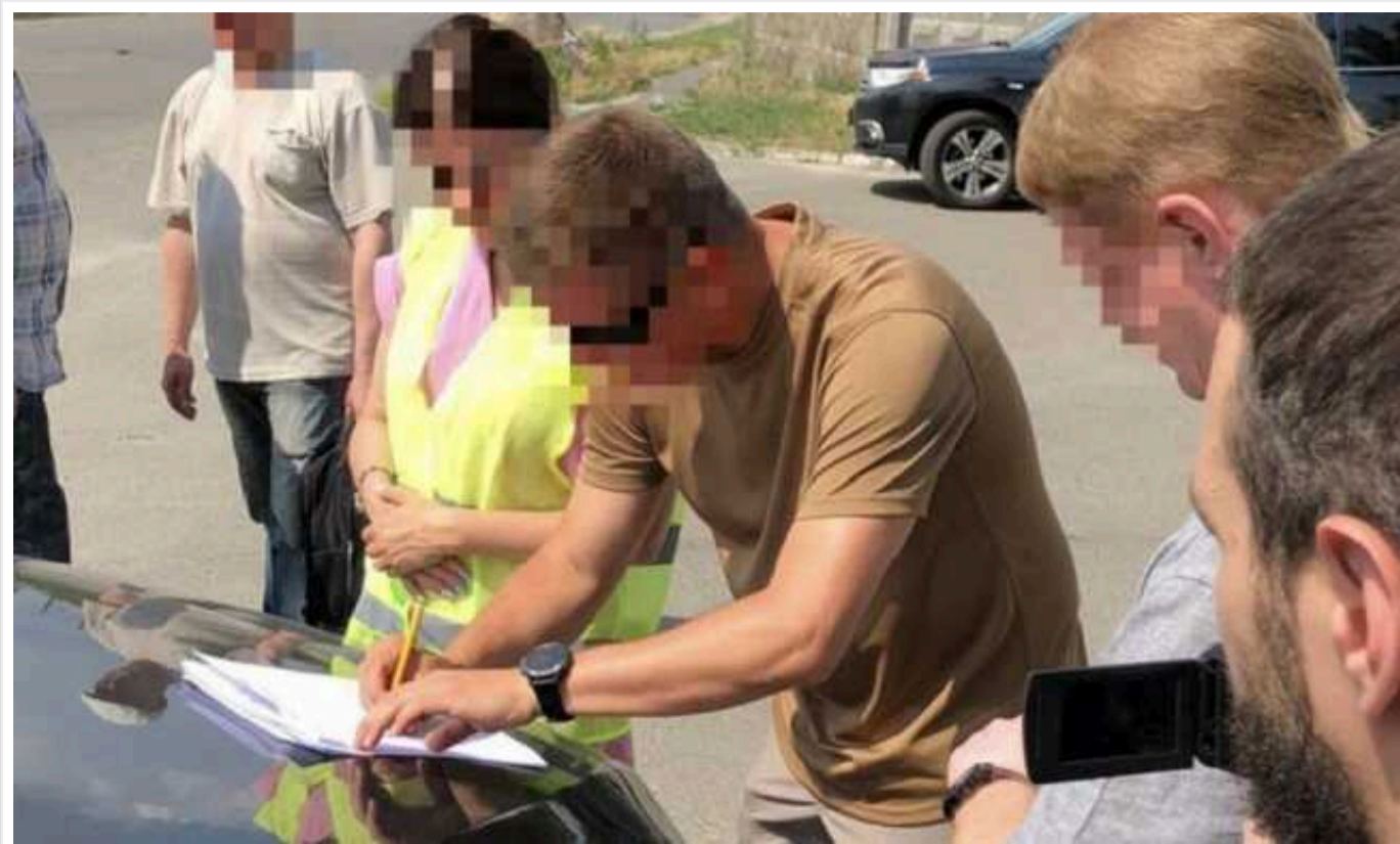
Директора Департаменту КМДА судитимуть за мільйонну розтрату при відновленні тротуару: загрожує до 12 років позбавлення волі