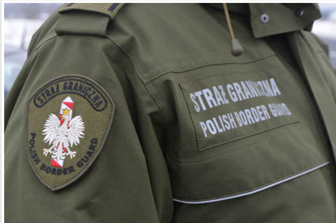
З Польщі видворили українця після гучної гулянки: вирішили що йому тут не місце

Польща видворила з країни 31-річного громадянина України. Цього разу справа стосувалася не перевезення нелегальних мігрантів.