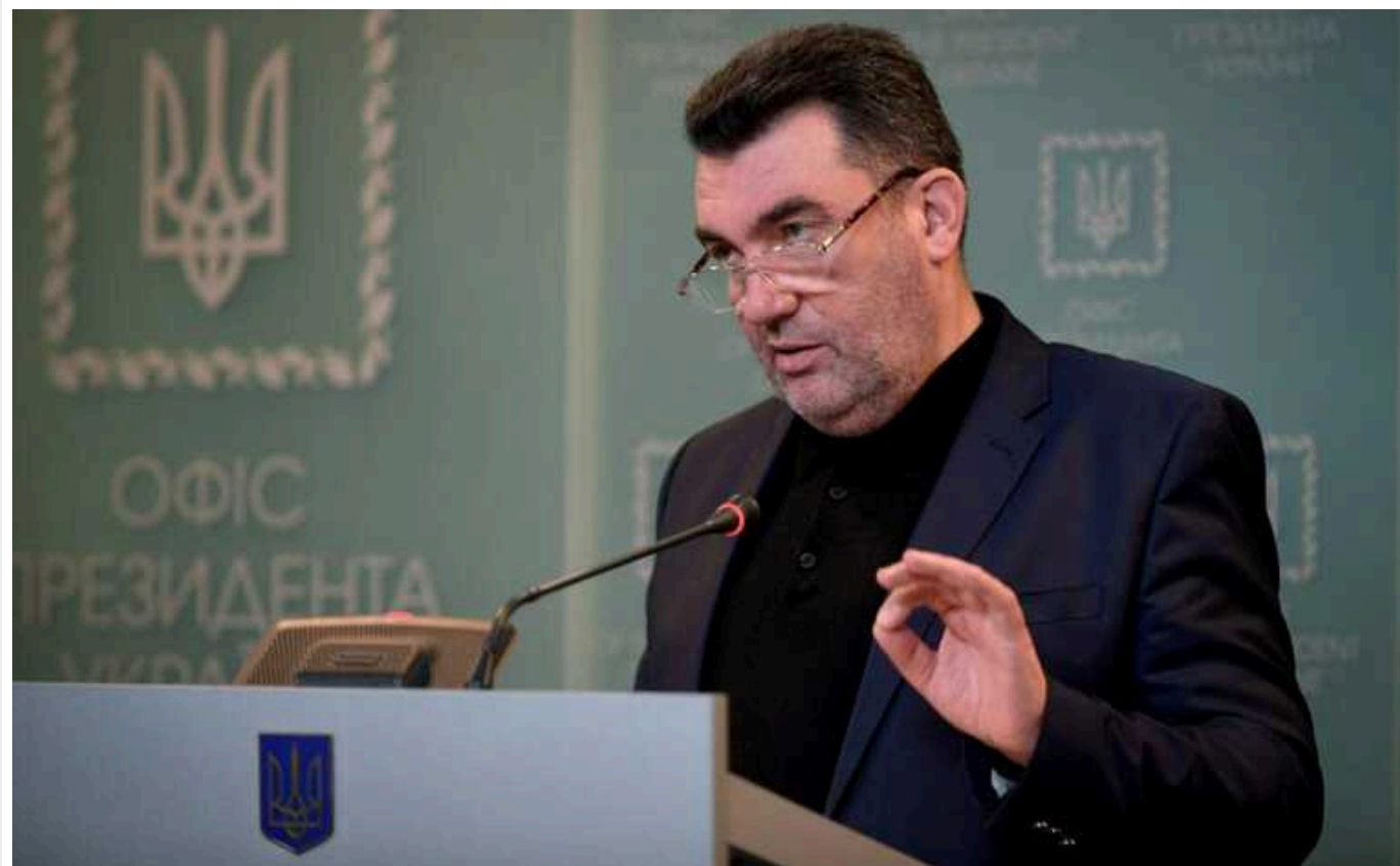
1000 кілометрів для нас уже не велика відстань, – Данілов про удари по РФ

Для Сил оборони України відстань у 1000 кілометрів вже не є недосяжною. По військових об'єктах Російської Федерації завдається багато ударів зброєю українського виробництва.