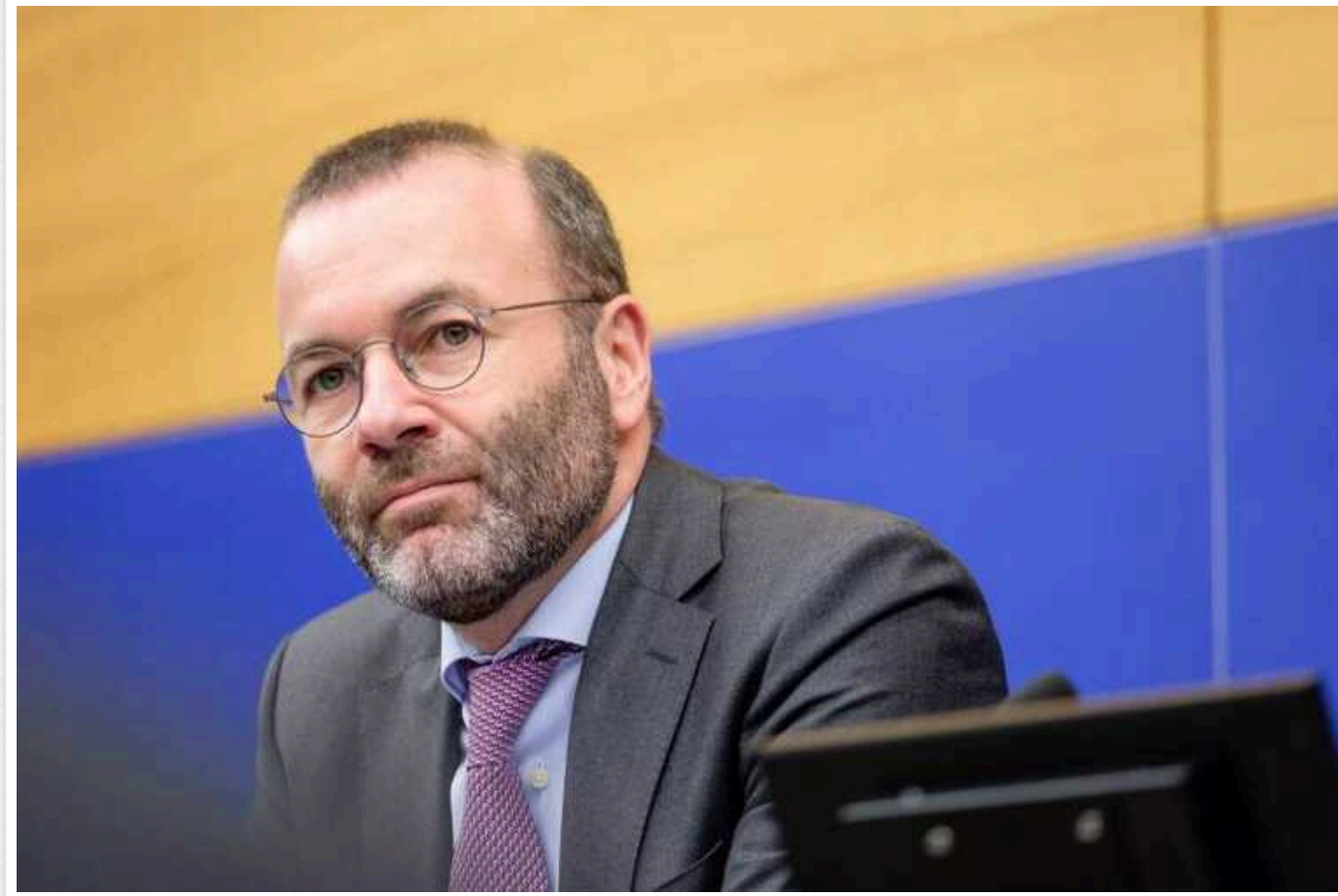
Президент ЕРР приїхав до Києва і дорікнув Фіцо за брехню про "відсутність війни"

Президент Європейської народної партії, голова відповідної групи Європарламенту Манфред Вебер, перебуваючи в Києві, відповів на скандальні заяви прем'єр-міністра Словаччини Роберта Фіцо. Останній раніше видав, що в українській столиці нібито "немає війни".