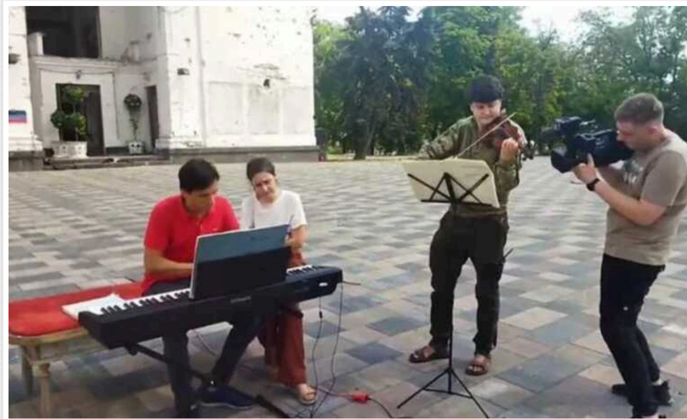
Українці домоглися скасування в Італії виступу російського піаніста, який раніше давав концерт у Маріуполі

В італійському Римі в Університеті Сап'єнца 23 січня мав відбутися концерт російського піаніста Олександра Романовського. Ця подія стала резонансною через протестувальників, адже поки Україна воює проти терористичної Росії, світ не мав би запрошувати її громадян та просувати їхню культуру. Українці пообіцяли, що у разі проведення концерту вони стоятимуть під університетом та будуть протестувати.