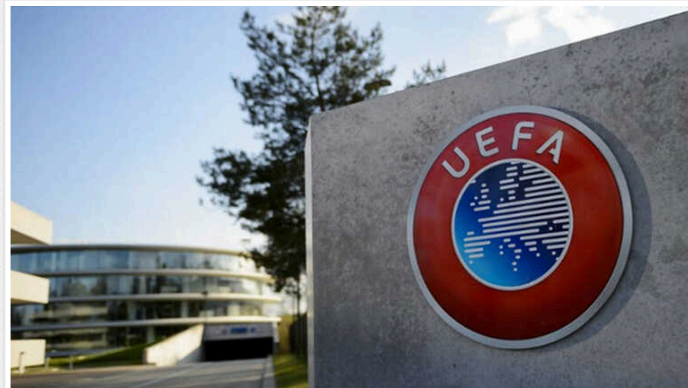
Президент УЄФА заявив про бажання допустити росіян до змагань, аби "уникнути промивання мозку дітям"

Президент Європейського футбольного союзу (УЄФА) Александер Чеферін виступив за пом'якшення санкцій щодо російських команд. Зокрема, словенський функціонер пропонує зняти обмеження на участь у міжнародних турнірах для молодіжних збірних та клубів.