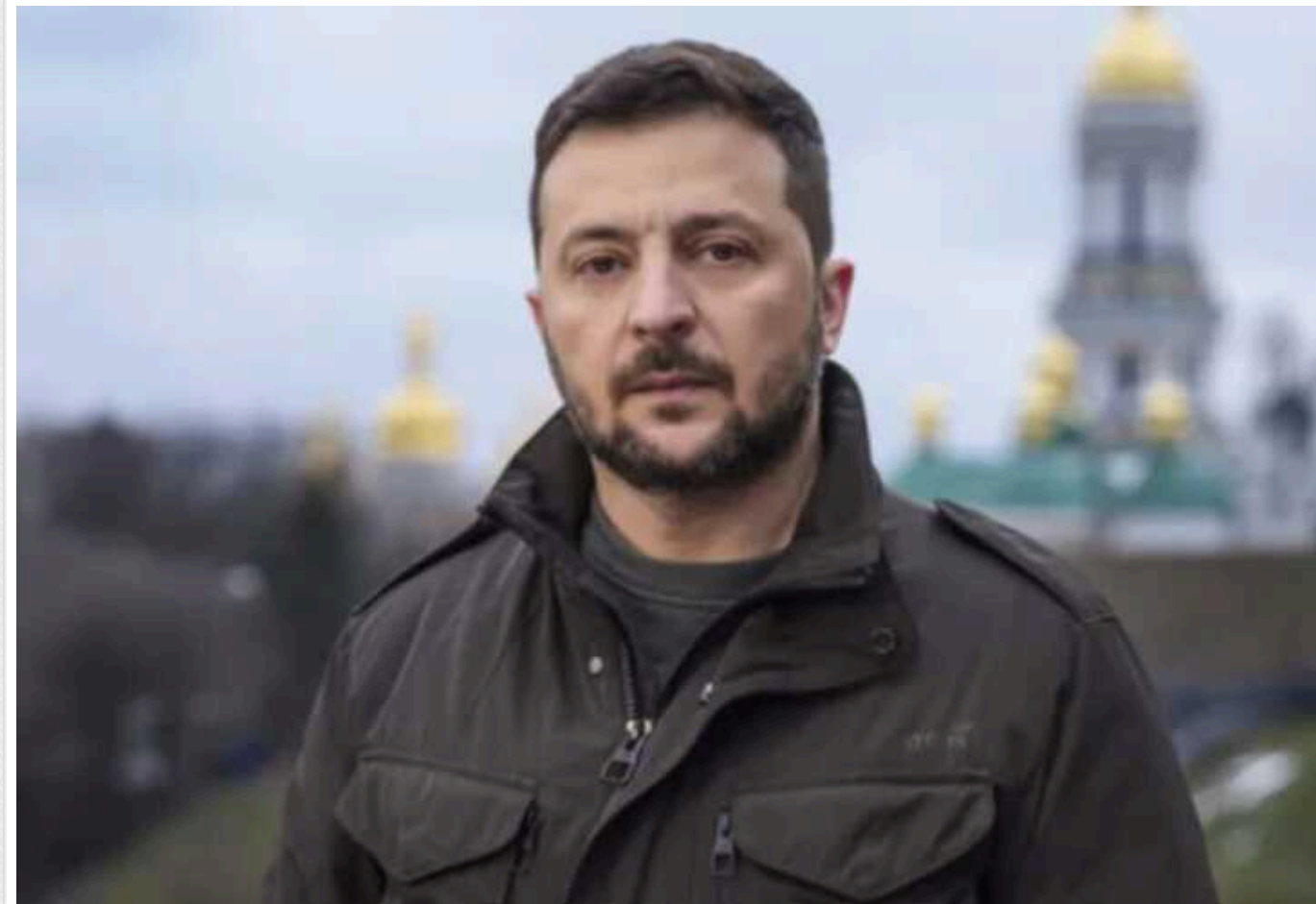
Зеленський привітав працівників зовнішньої розвідки України зі святом: "Публічно майже нічого не можемо розповісти"

Президент України Володимир Зеленський привітав із професійним святом співробітників Служби зовнішньої розвідки України. Глава держави відзначив роботу розвідників, ефективність якої стає передумовою багатьох здобутків України.