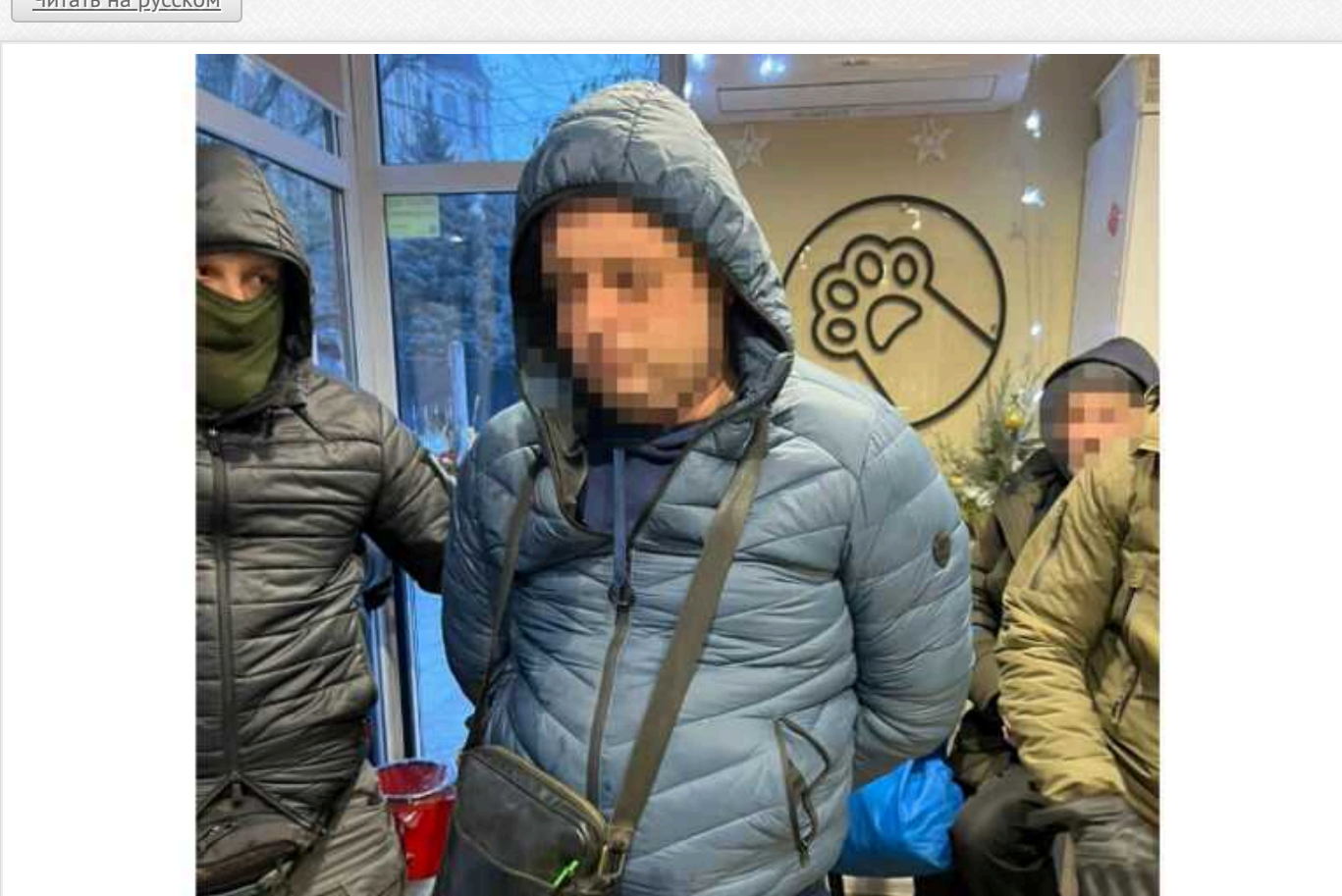
У Києві на гарячому затримали лікаря, який за 9000 доларів обіцяв ухилянтам зняття з військового обліку

У Києві викрили медика одного з комунальних закладів столиці, який за винагороду обіцяв чоловікам зняття з військового обліку. Свої "послуги" він оцінив у 9 тисяч доларів США.