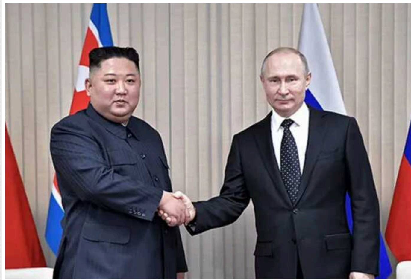
У США занепокоїлися зближенням Росії і КНДР

Поглиблення відносин між Російською Федерацією та КНДР викликає занепокоєння у Вашингтоні. Це може вплинути на безпеку в регіоні Корейського півострова, а також у Європі.