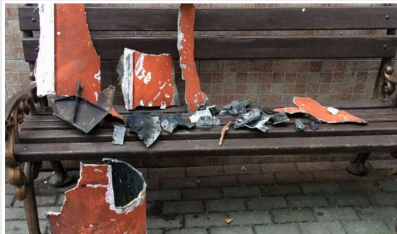
Працівники муніципальної охорони київського парку знайшли уламки збитої російської ракети

У Дарницькому районі працівники муніципальної охорони виявили уламки російської ракети, якою країна-терорист атакувала Київ 23 січня. На місці працювали правоохоронці та сапери.