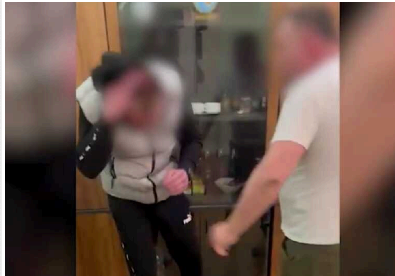
ДБР передало до суду справу військкомів із Рівного, які побили підлеглого

За версією слідства, влітку 2023 року їм стало відомо, що водій стрілецької роти в одному з військових підрозділів Рівненського районного територіального центру комплектування планує повідомити про їхні порушення під час служби. Для запобігання цьому вони вдалися до його побиття.