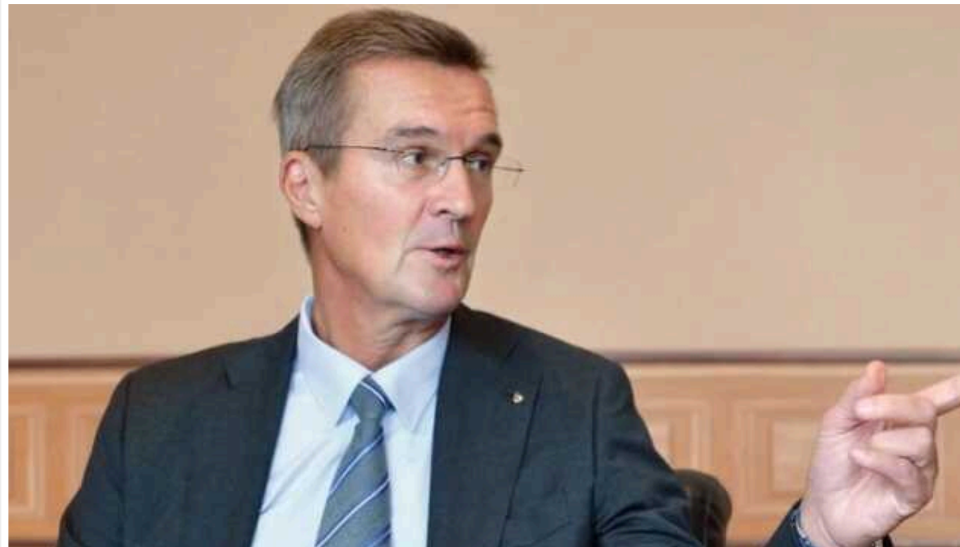
СБУ оголосила підозру директору підсанкційного холдингу РФ, що виготовляє КАБи та ракети

Служба безпеки України збрала доказову базу на генерального директора російської корпорації «Тактичне ракетне озброєння» Бориса Обносова, який сприяє збройній агресії РФ.