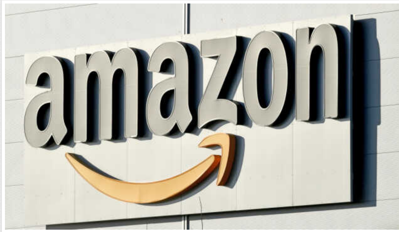
У Франції оштрафували Amazon на 32 мільйони євро через стеження за робітниками

Французьке агентство із захисту даних (CNIL) повідомило у вівторок, що оштрафувало французький складський підрозділ компанії Amazon на 32 млн євро за «надмірно нав'язливу» систему стеження за роботою персоналу.