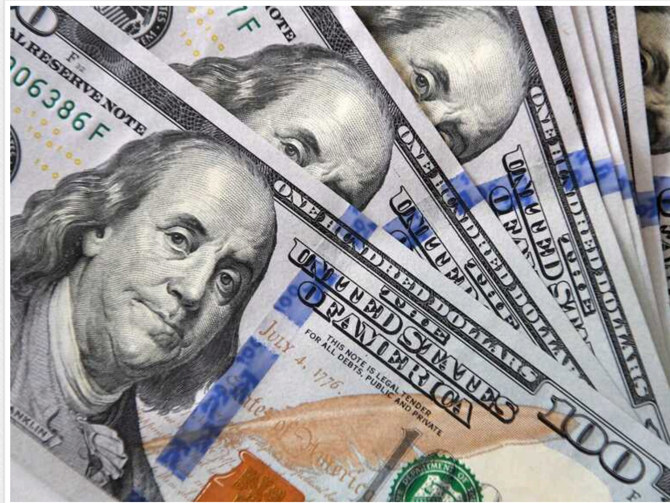
Reuters: Чому в Європі бояться віддати 300 мільярдів доларів російських грошей

Очікується, що замість того, щоб конфіскувати заморожені російські активи та передати їх Україні, країни Європейського Союзу поділяться тільки прибутком, отриманим від активів, і не чіпатимуть основну суму.