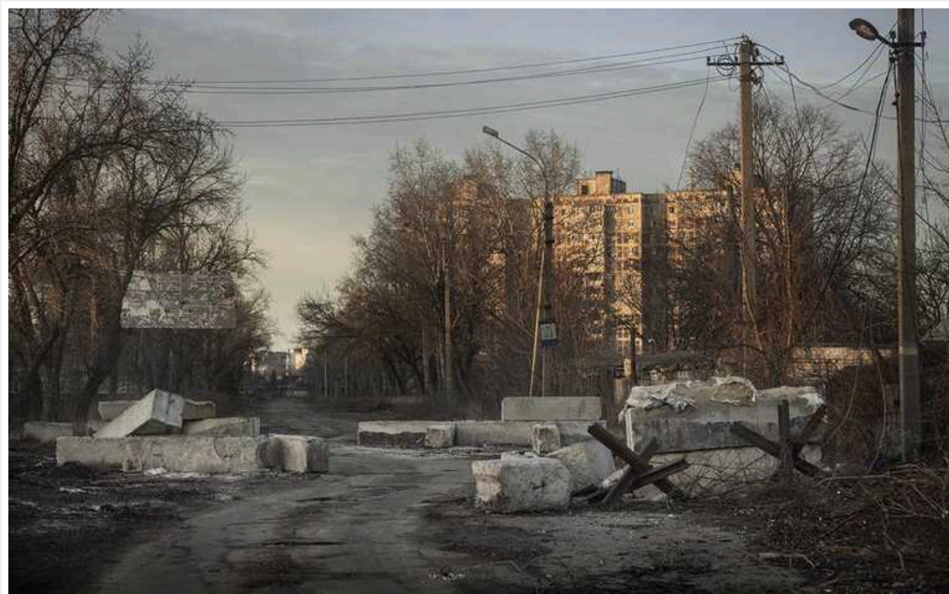
Російський військкор визнав, що втрати армії РФ під Авдіївкою вдесятеро перевищують втрати ЗСУ

У Генштабі ЗСУ стверджують, що на Авдіївському напрямку українські захисники продовжують стримувати ворога, який не полишає спроб оточити Авдіївку. Впродовж минулої доби Сили оборони загалом ліквідували 840 російських солдат.