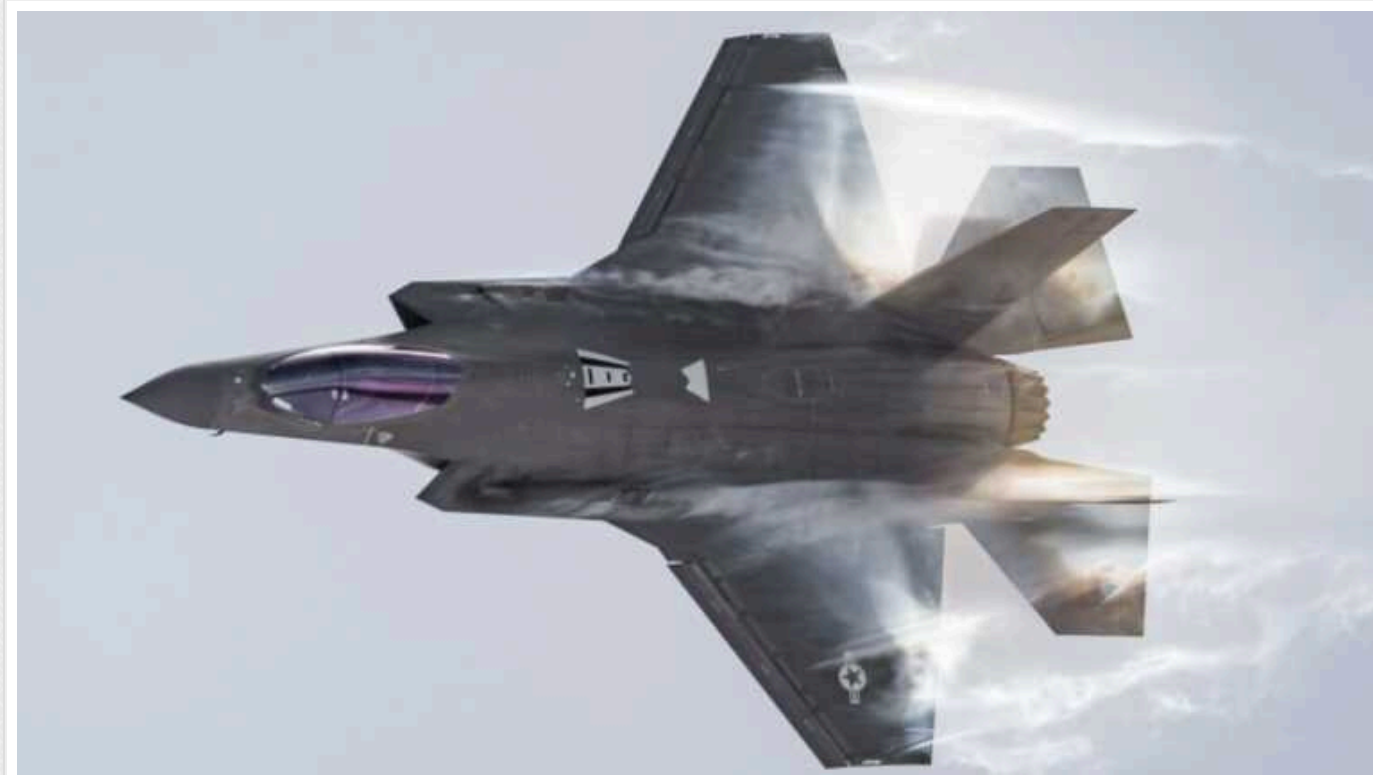
Виробництво F-35 із пакетом ПЗ TR-3 затримується на пів року

Оновлення TR-3 має стати кроком до глобального оновлення Block 4, але воно затримується майже на півроку. До кінця 2024 року на складах виробника може накопичитися до 120 винищувачів F-35.