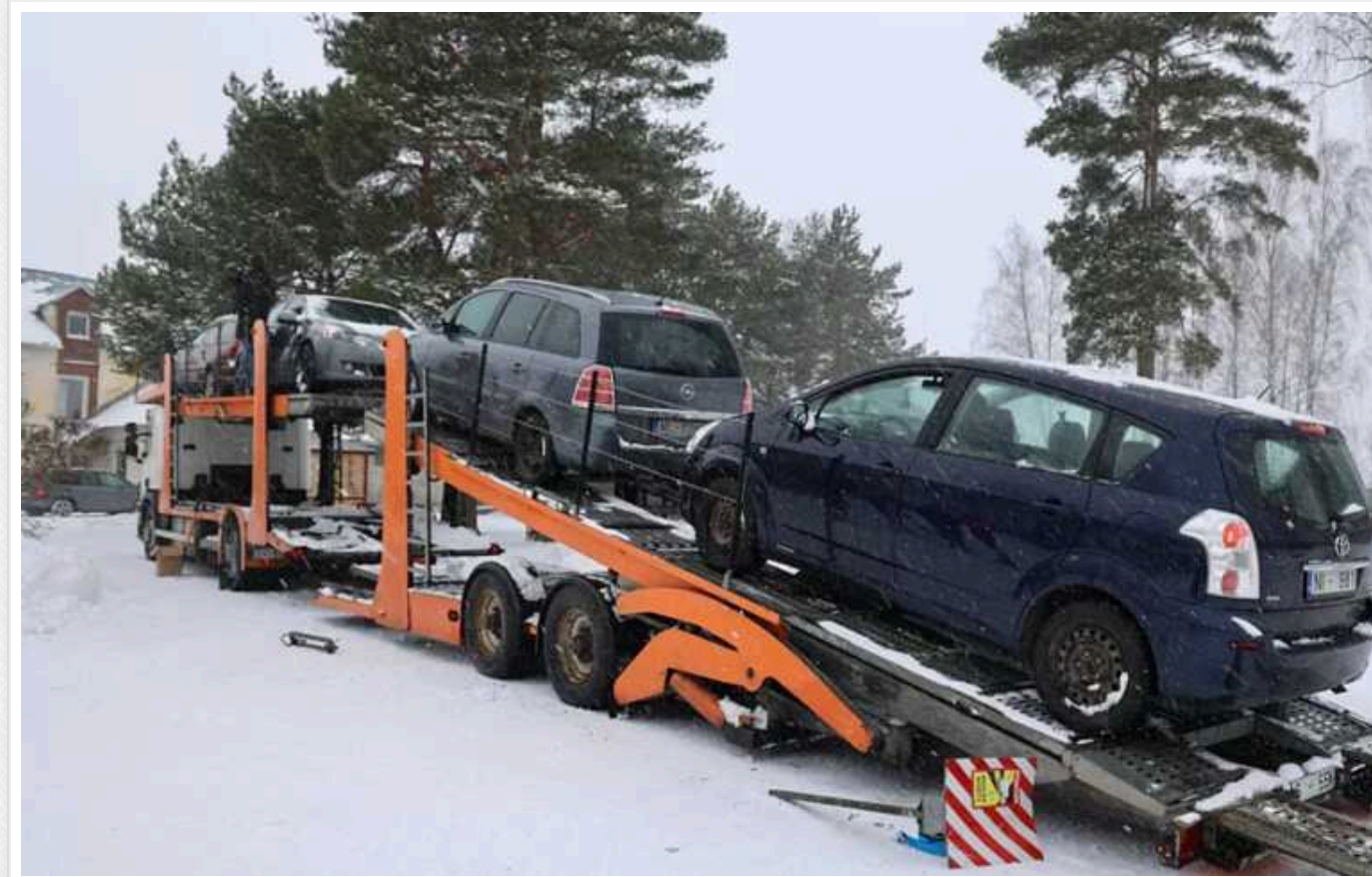
Латвія передасть Україні нову партію автомобілів, конфіскованих у п'яних водіїв

Уряд Латвії ухвалив рішення безоплатно передати Україні ще одну партію автомобілів, конфіскованих у п'яних водіїв.