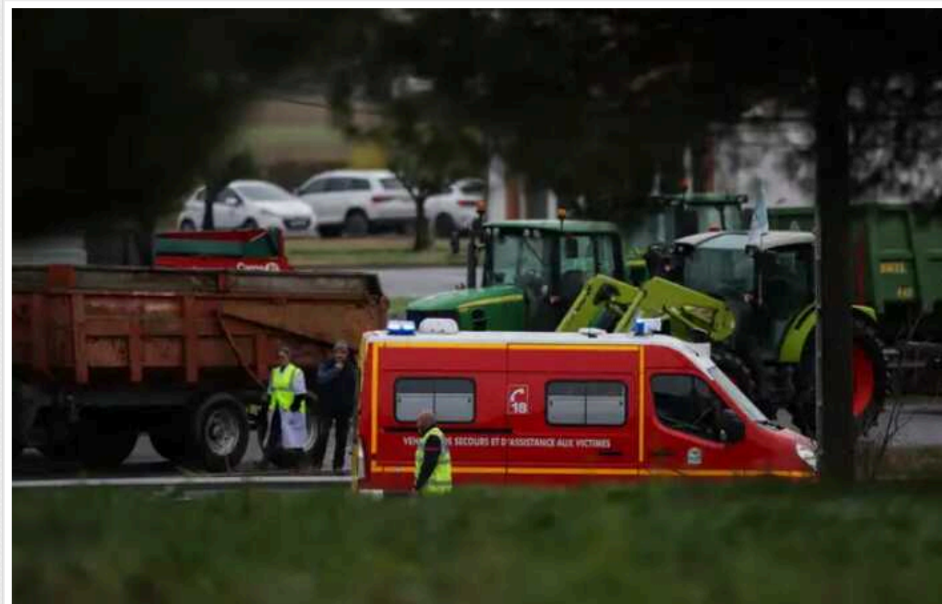
Протести фермерів у Франції: померла друга постраждала внаслідок наїзду на барикаду протестувальників

12-річна донька жінки, яка загинула внаслідок наїзду авто на барикаду протестуючих фермерів, також померла у лікарні.