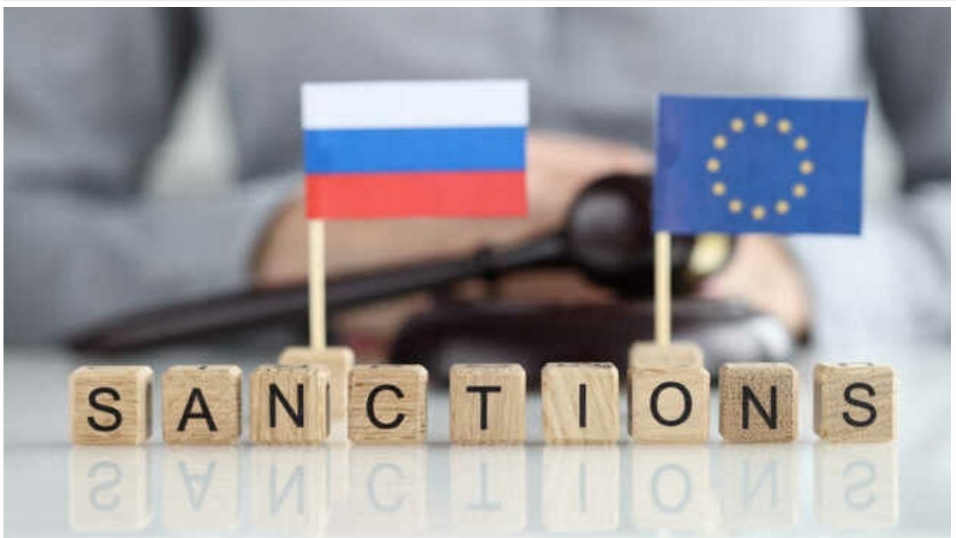
Новий пакет санкцій проти Росії стосуватиметься алюмінію, – Politico

До наступного пакету санкцій ЄС проти Росії увійде продукція з алюмінію.