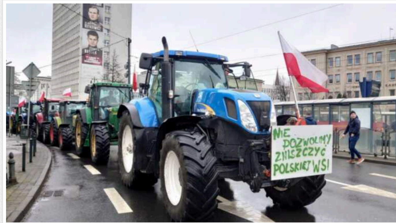
Польські фермери планують розпочати великі протести через імпорту агропродукції з України

Сьогодні, 24 січня, у Польщі починається загальнонаціональний протест фермерів, які вимагатимуть захистити їхній бізнес від імпорту з третіх країн, зокрема з України.