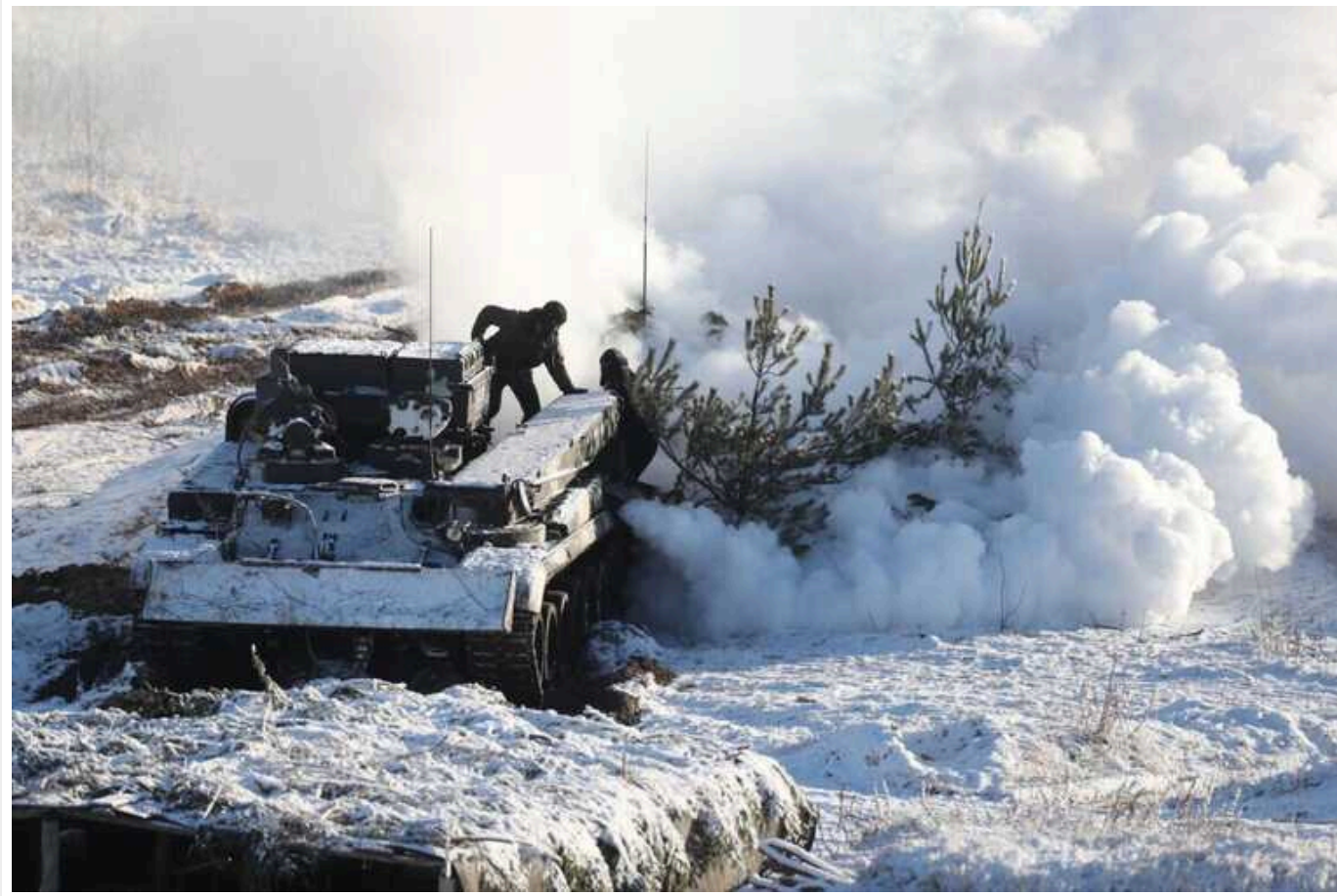
Ситуація на фронті: Окупанти активізувались на Мар'їнському напрямку

Російські окупанти атакували на 7 напрямках, найактивніше – на Авдіївському та Мар'їнському, загалом за добу на фронті відбулося 56 бойових зіткнень, загарбники завдали 48 ракетних та 112 авіаційних ударів, здійснили 73 обстріли з реактивних систем залпового вогню по позиціях українських військ та населених пунктах.