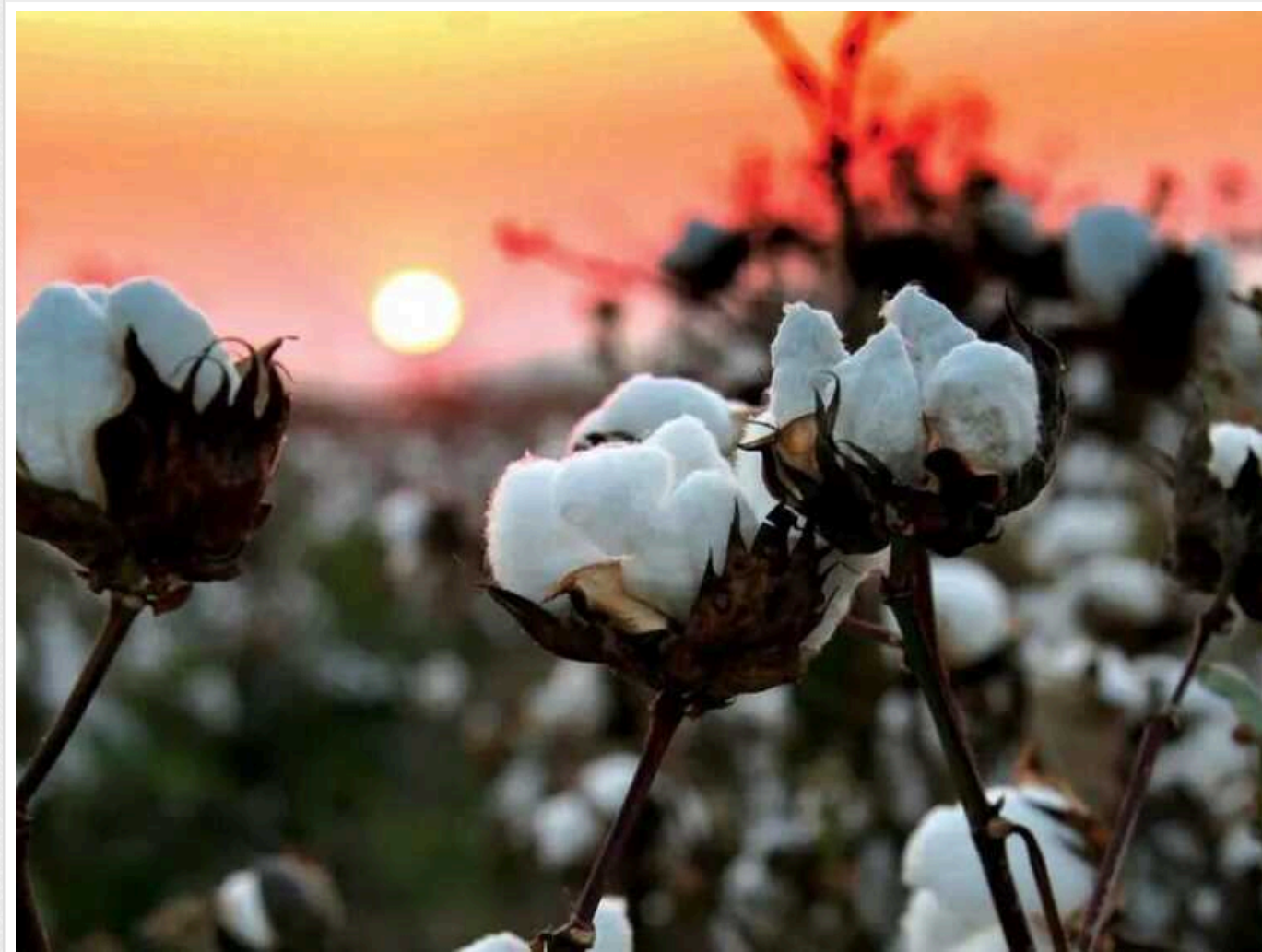
Нова "бавовна" в Орловській області: росіяни влаштували істерику

Вночі 24 січня відбулася атака дронів на Орел у Росії. Внаслідок нальоту пошкоджено кілька будинків у Северному та Залізничному районах міста.