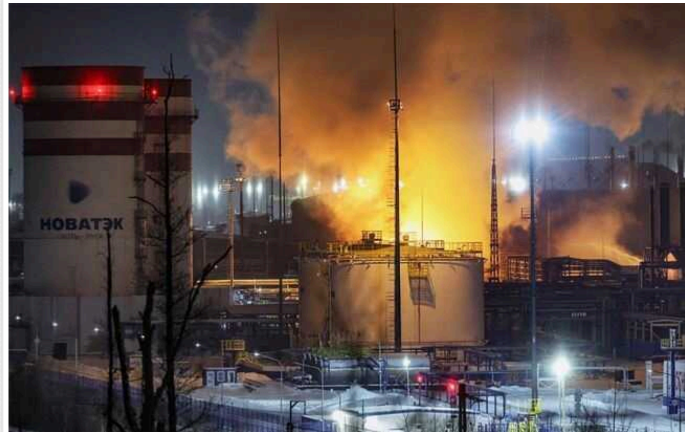
РФ відновила завантаження палива в терміналі в Усть-Лузі, який атакували дрони, – Reuters

Російська енергетична компанія "Новатек" відновила відвантаження палива на своєму терміналі в Усть-Лузі на Балтійському морі, пошкодженому внаслідок атаки дронів.