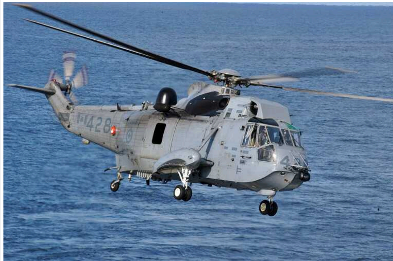
Юліан Рьопке розкритикував вертольоти Sea King, які Німеччина передасть Україні

Військовий оглядач німецького видання Bild Юліан Рьопке висловив критику щодо транспортних вертольотів Sea King, які Німеччина вчора погодилася передати Україні.