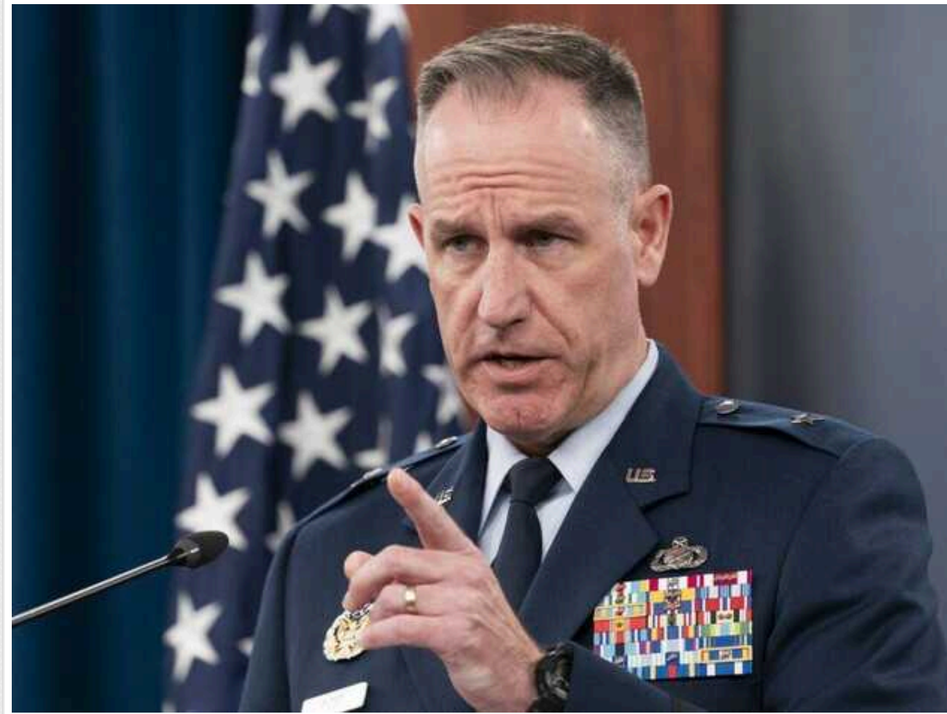
Без фінансування ми не можемо допомогти Україні з ремонтом наданого раніше озброєння, – Пентагон

У Пентагоні заявили, що відсутність фінансування впливає не тільки на спроможність США надіслати озброєння Україні, а й допомагати з ремонтом вже наданого.