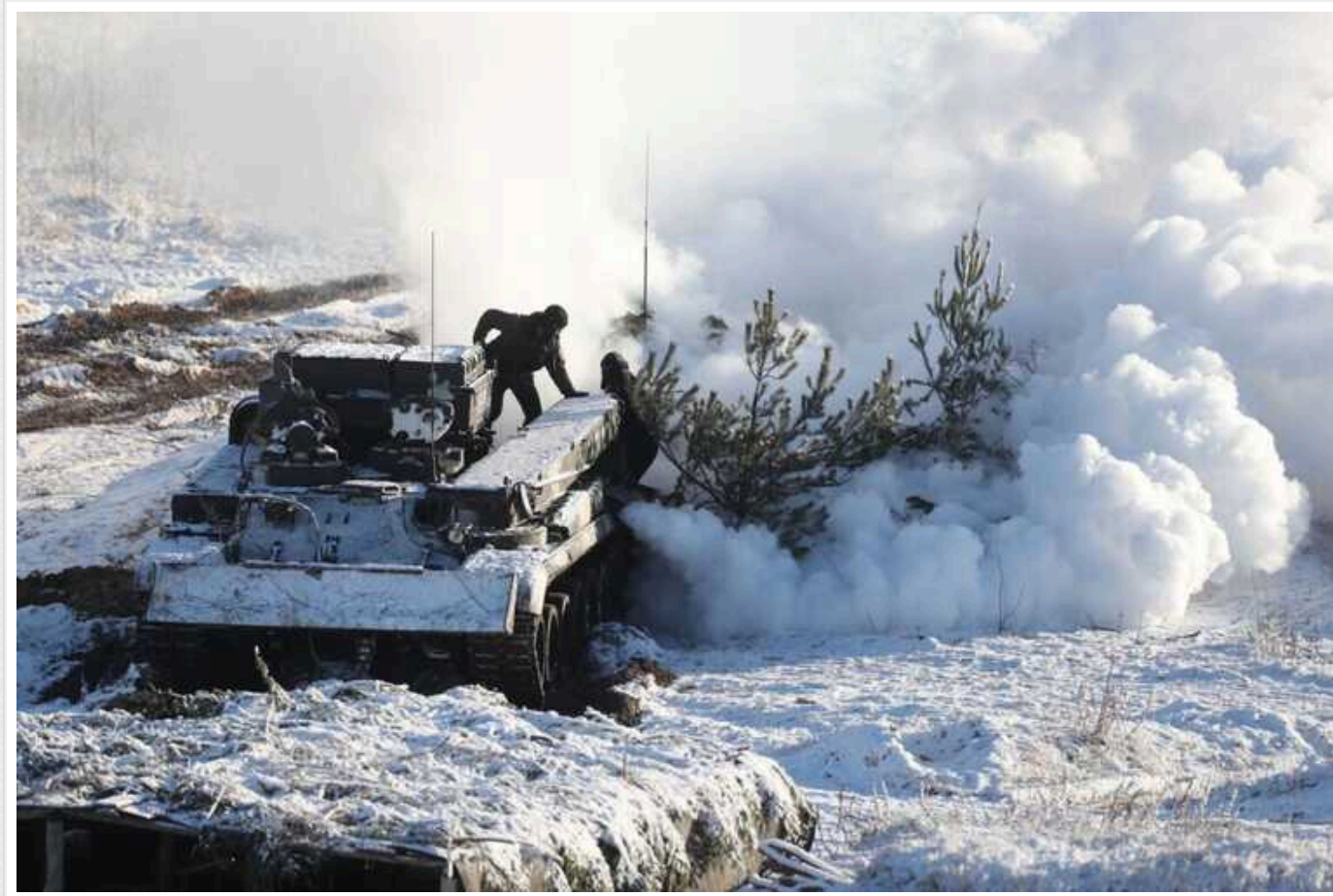
Втрати ворога: ЗСУ ліквідували ще 840 окупантів та 61 артсистему

Захисники України протягом боїв на фронті минулої доби знищили 223 одиниці російського озброєння і військової техніки. Також воїни ліквідували 840 загарбників.