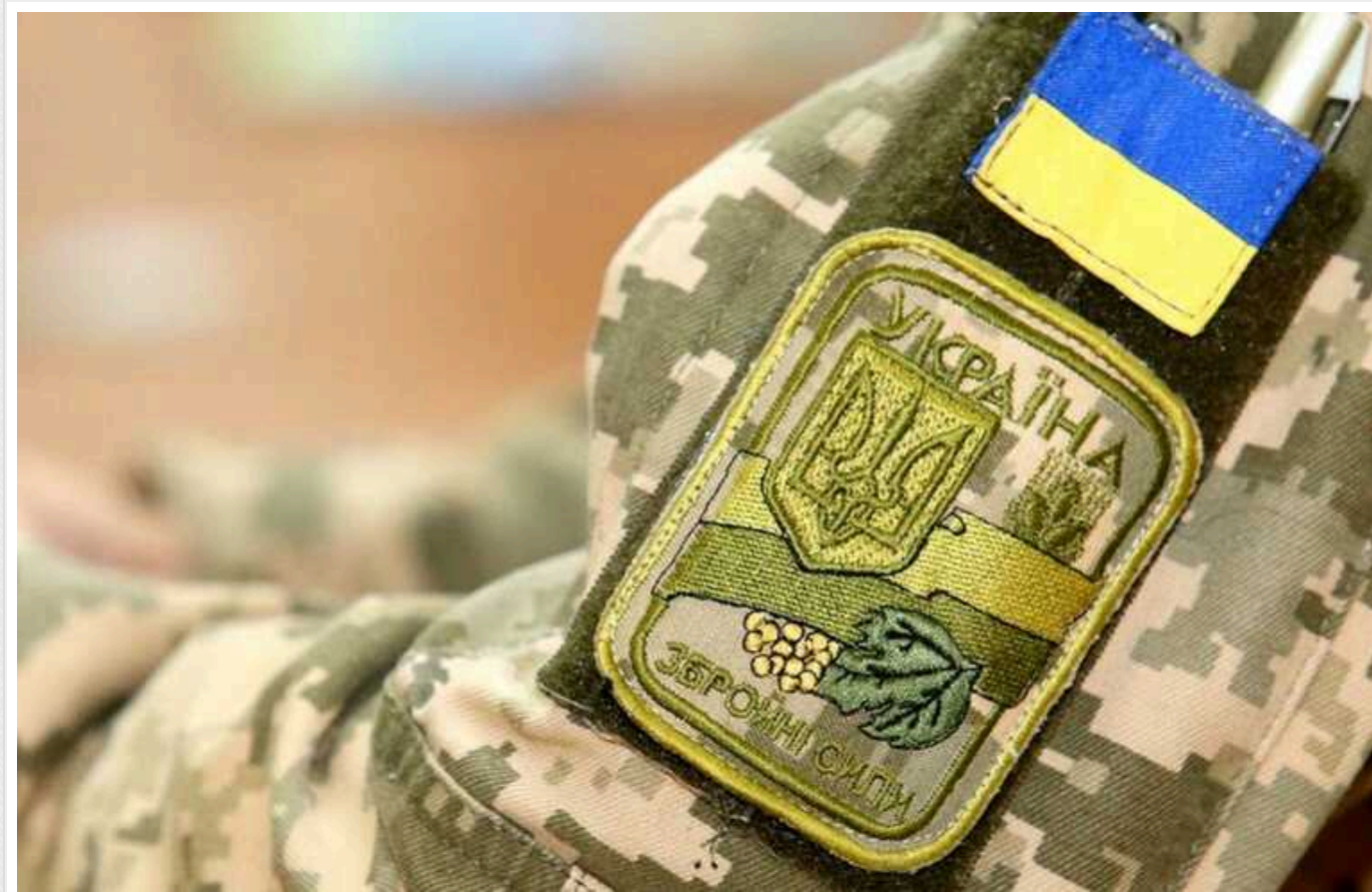
У Львівській області судили військового, який годину був відсутній на службі

Стрийський міськрайонний суд Львівщини визнав винним у недбалому ставленні до військової служби Сергія К., який був відсутній на службі одну годину – чоловік спізнився на ранкове шиккування. Суд призначив йому покарання – 17 тис. грн штрафу.