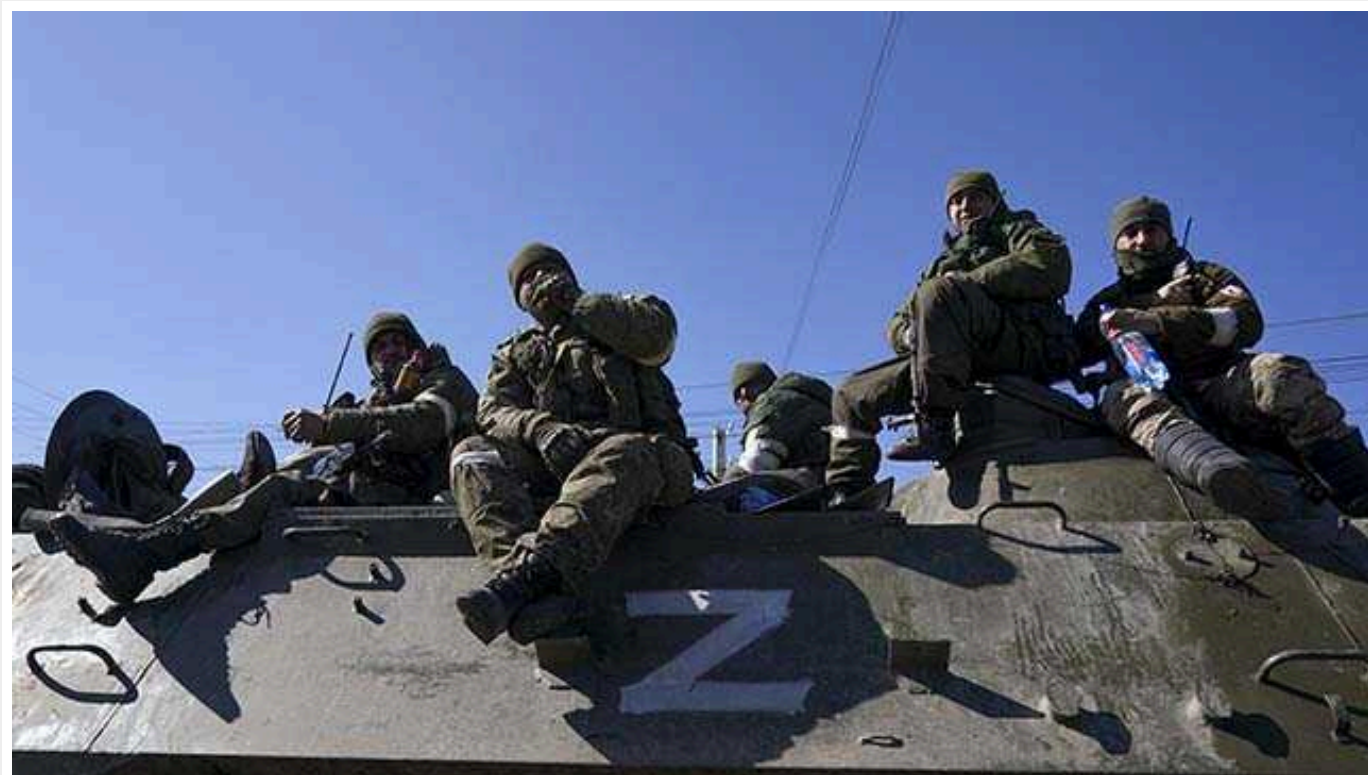
РФ намагається вийти з позиційної війни, – ISW

За даними експертів Інституту вивчення війни (ISW), російські окупаційні війська намагаються компенсувати удари українських дронів, щоб вийти з позиційної війни.