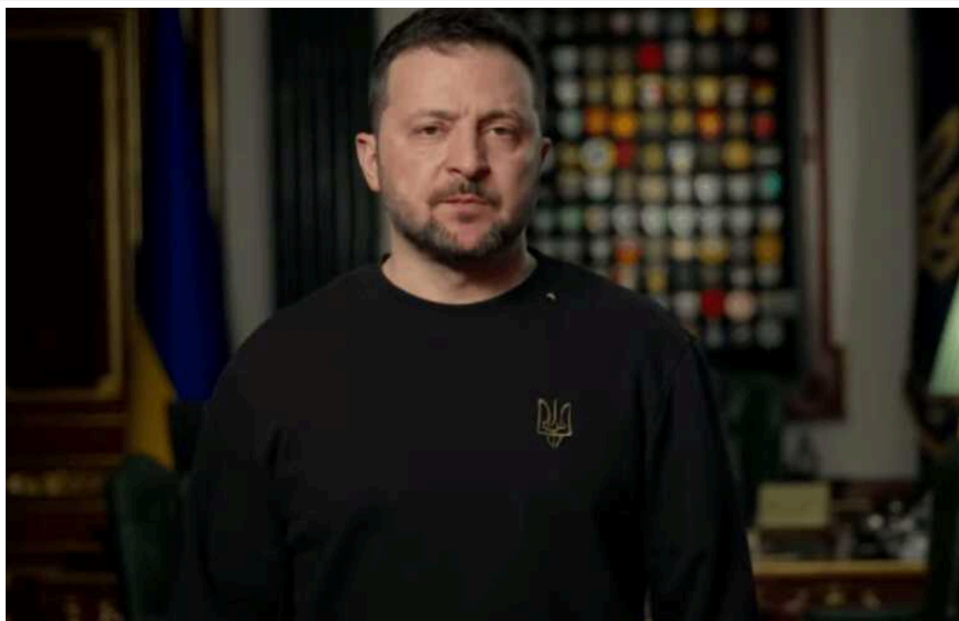
Зеленський озвучив нове рішення РБНО щодо тиску на бізнес

Володимир Зеленський анонсував запровадження мораторію на блокування роботи компаній під час процесуальних дій та проведення аудиту системи моніторингу ризиків податкових накладних.