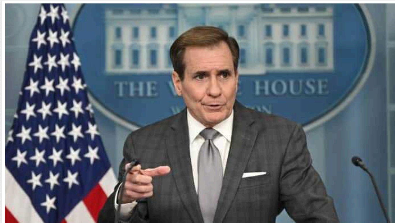
Росія хоче більше жертв серед цивільних в Україні, щоб "зламати волю", – Кірбі

Кремль концентрує увагу на завданні ударів по цивільній інфраструктурі та об'єктах оборонної промисловості в Україні, у спробах виснажити ППО ЗСУ. Загарбники, зокрема, намагаються збільшити кількість жертв серед мирних жителів задля деморалізації.