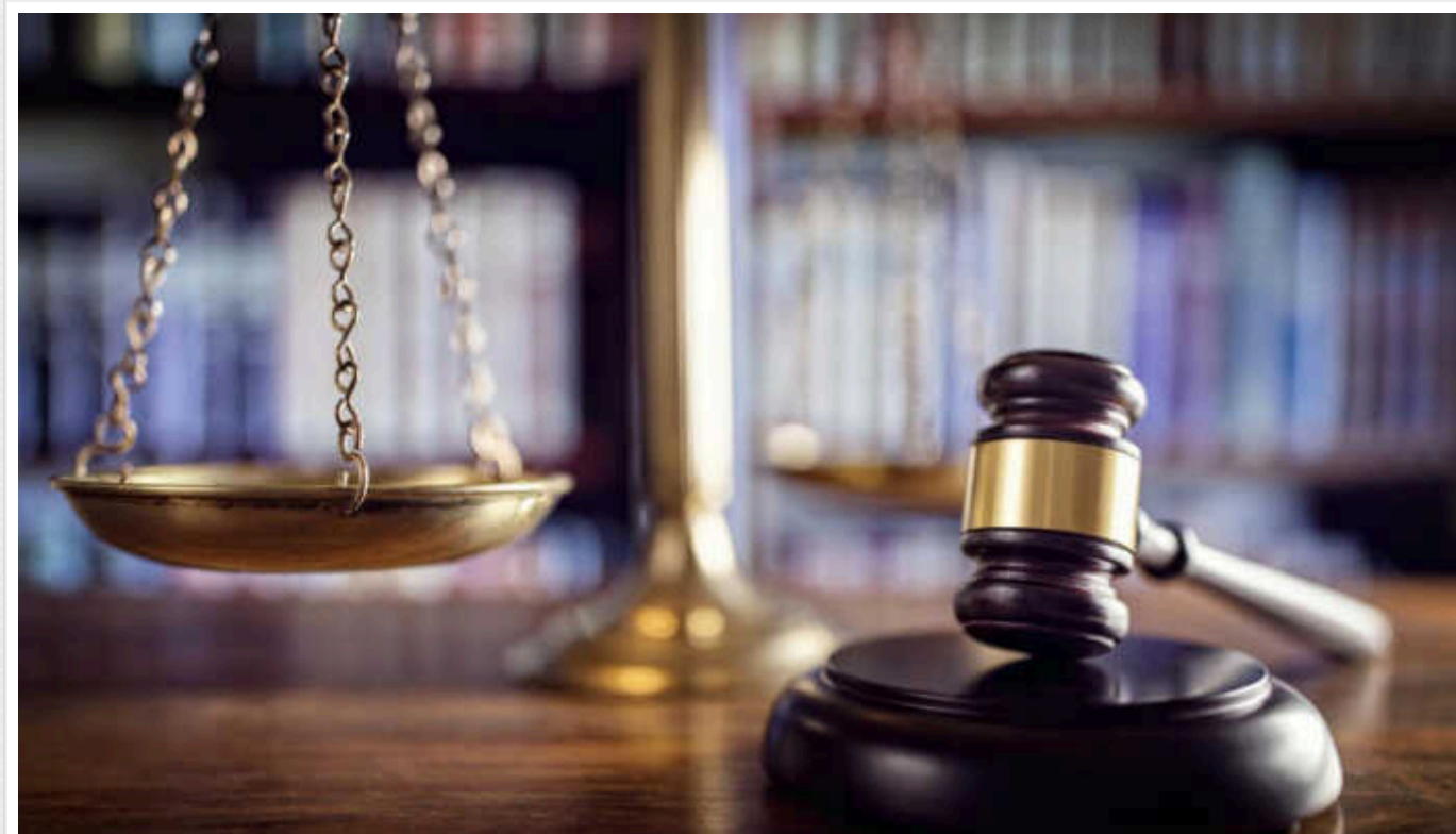
У Львівській області судитимуть чоловіка за розбещення та ґвалтування трьох неповнолітніх дівчат

На Буковині чоловік систематично ґвалтував та знищався з двох своїх падчерок та рідної доньки. Усі розпусні дії буковинець записував на відео і зберігав в своєму мобільному телефоні. Поліцейські завершили розслідування, зібрали достатньо фактів та передали справу до суду. Чоловіку загрожує довічне ув'язнення.