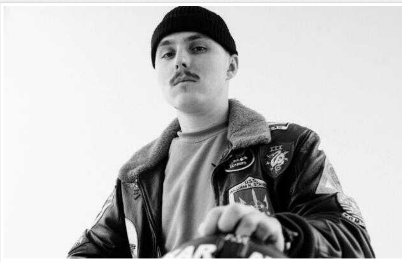
Благодійники створили календар із зображеннями відомих українських захисників

В Україні стартує фотопроєкт «Лють» в якому взяли участь 12 військових. Всі фото розмістили у календарі, де кожен з військових символізуватиме наступні 12 місяців стійкості та хоробрості 2024 року. Кошти з продажу календарів благодійний фонд «1991», який є ініціатором проєкту, скерує на покупку 500 FPV дронів для захисників.