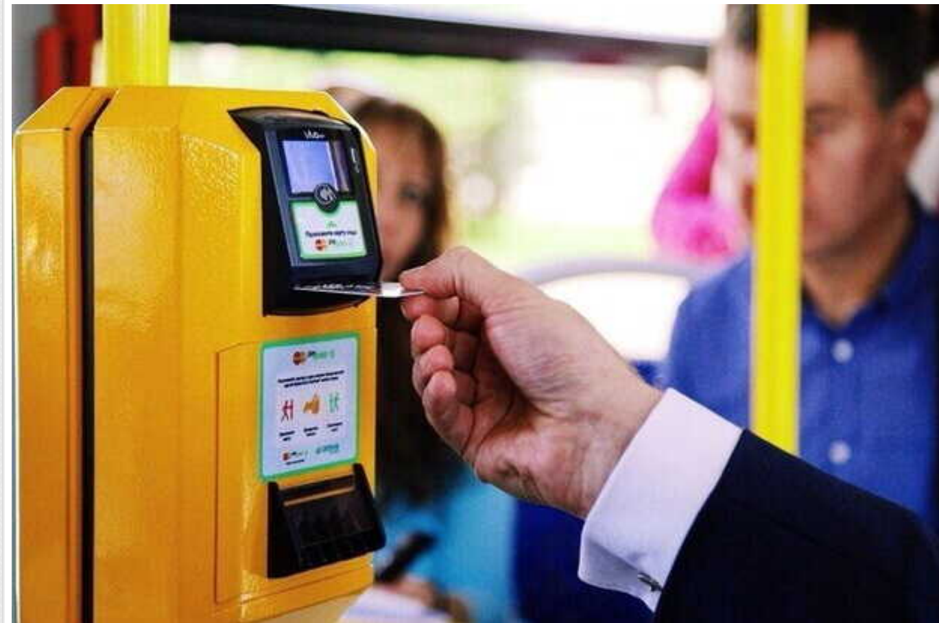
На Львівщині мешканцям платитимуть по 200 грн за повідомлення про непрацюючі валідатори в маршрутках

Компанія «Смарт-Тикет Технологджи», яка займається впровадженням е-квитка на Львівщині, закликала пасажирів повідомляти про порушення у роботі водіїв міжміських та приміських автобусів, які стосуються безготівкової оплати. Натомість пасажирам обіцяють грошову винагороду – 200 грн.