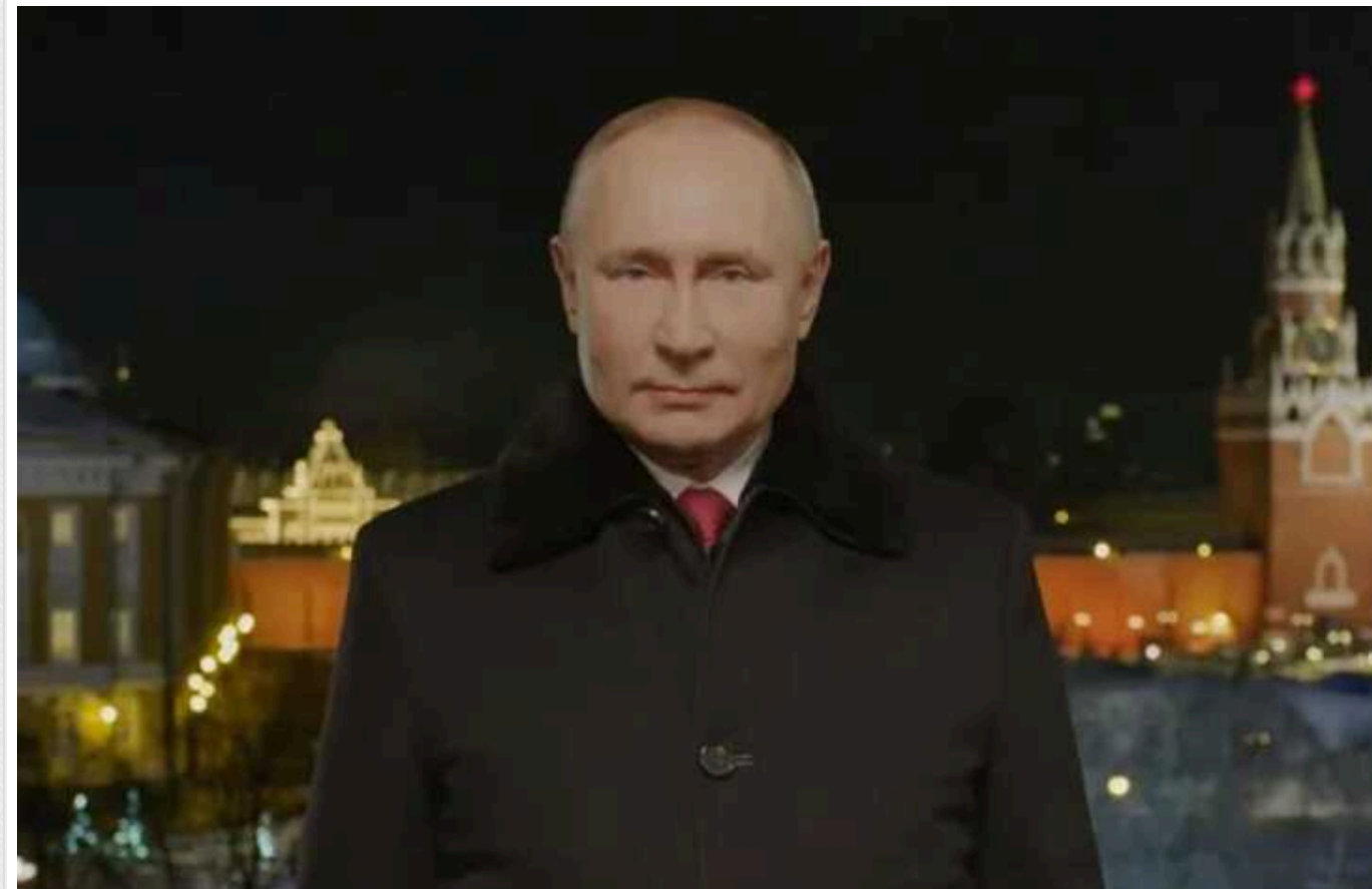
СБУ викрила російську ІПСО: намагалася через email посіяти паніку серед українців

Служба безпеки України викрила російську інформаційно-психологічну операцію (ІПСО), яка через email-розсилку намагається посіяти паніку серед українців. У листах ворог пропонує співпрацю зі своїми спецслужбами за винагороду з метою дестабілізувати ситуацію всередині України.