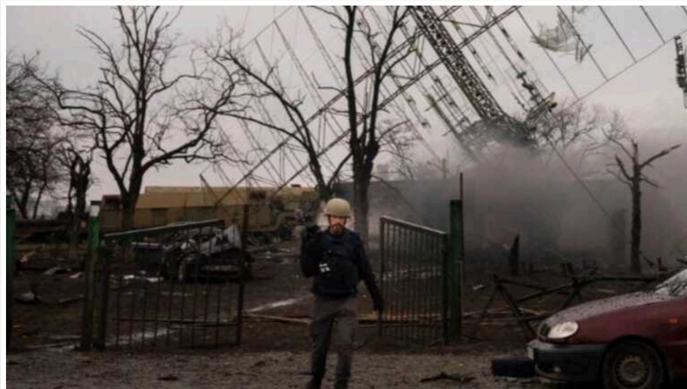
Український фільм "20 днів у Маріуполі" номінували на "Оскар"

Український фільм "20 днів в Маріуполі" режисера та відеографа Мстислава Чернова офіційно став номінантом на престижну премію "Оскар-2024" у категорії "Найкращий повнометражний документальний фільм". Він змагатиметься з 4 іншими картинами за заповітну статуетку.