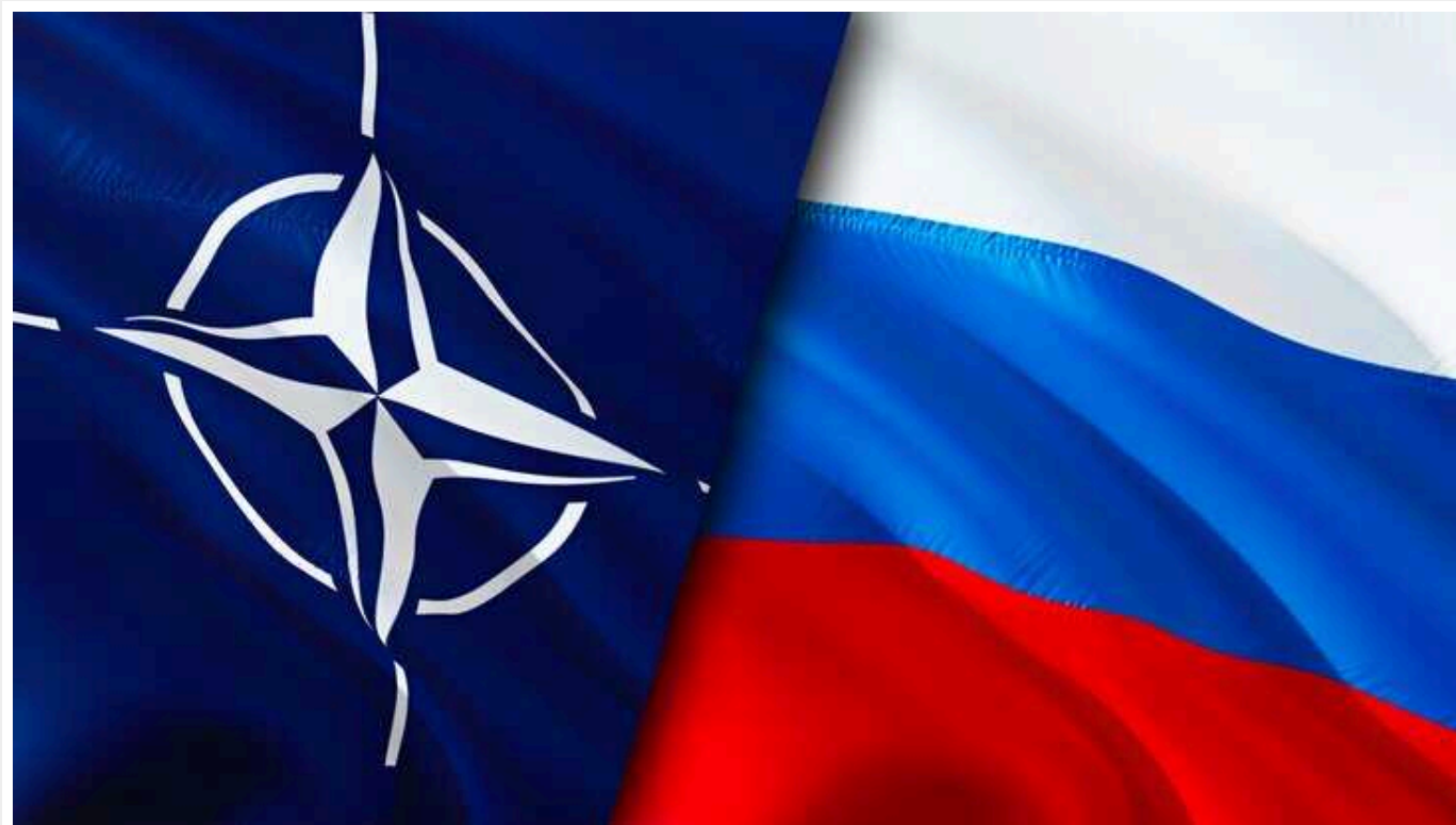
В українській розвідці оцінили загрозу нападу РФ на НАТО

На те, що Російська Федерація становить загрозу для безпеки в Європі та країнах НАТО, вказують певні сигнали. Відповідні дані має також Головне управління розвідки Мінборони України.