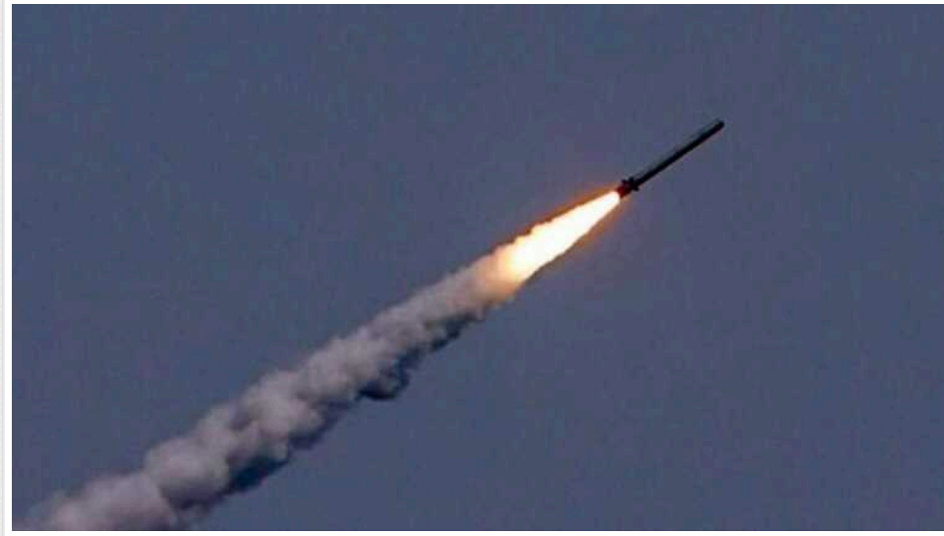
Харків знову під обстрілом: окупанти завдають удари по житловим кварталам

Харків знову під обстрілом, і знову росіяни б'ють по житловим кварталам.