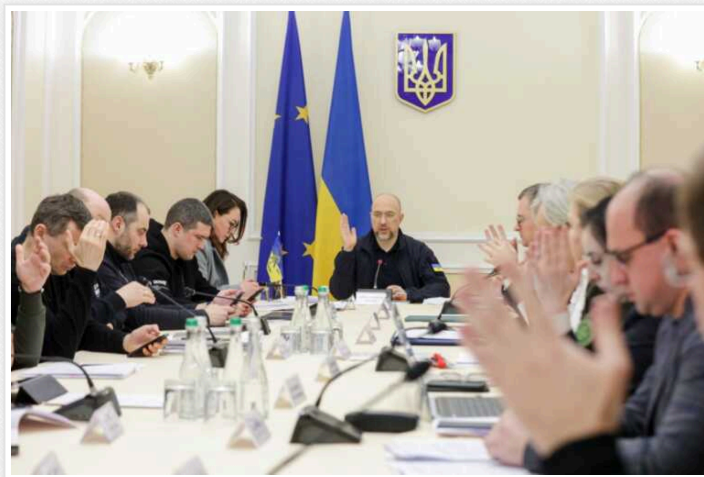
Уряд передає силам оборони 9,6 мільярда гривень військового ПДФО, - Шмигаль

Кабінет міністрів України (КМУ) ухвалив рішення про передачу силам безпеки й оборони 9,6 млрд гривень податку з доходів фізичних осіб (ПДФО), які сплачують військовослужбовці (так зване "військове ПДФО"). Одночасно на Кабміні було ухвалено рішення, що 10% від військового ПДФО буде направлено військовим частинам напрому.