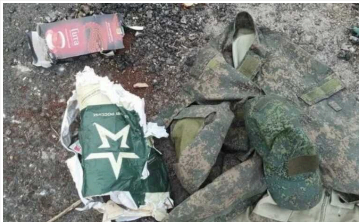
Окупант скаржиться на втрати та "кротів", які передають ЗСУ час штурмів, — перехоплення

Головне управління розвідки Міністерства оборони України опублікувало перехоплення розмови російського окупанта з дружиною – той розповідає про вбитих росіян, яких не забирають із позицій, і про "злив" інформації українським військовим.