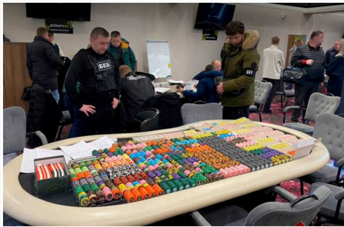
В Україні припинили діяльність мережі покер-клубів

Детективи БЕБ припинили незаконну діяльність мережі покер-клубів у Києві, Харкові та Одесі.