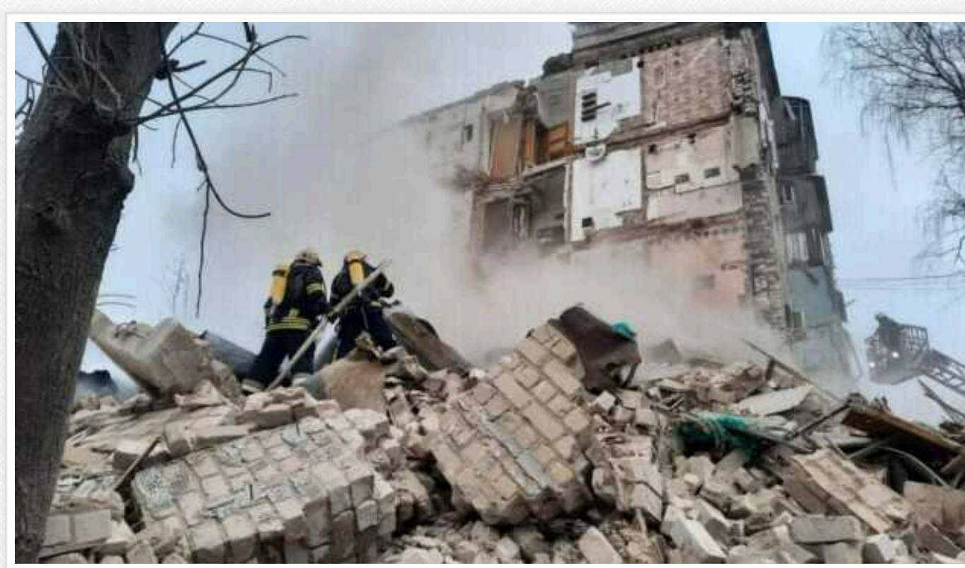
Генпрокурор назвав кількість жертв сьогоднішнього російського обстрілу: найбільше в Харківській області

В Україні внаслідок сьогоднішніх російських обстрілів станом на зараз відомо вже про 19 загиблих. Найбільша кількість жертв - у Харківській області.