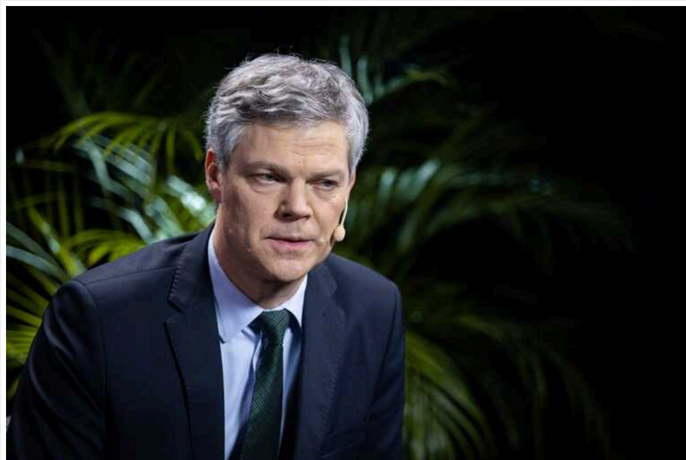
Мета Росії - довгострокова конфронтація із Заходом, - спецслужби Литви

Метою російського диктатора Володимира Путіна є не тільки поразка України, а й довгострокова конфронтація із Заходом.