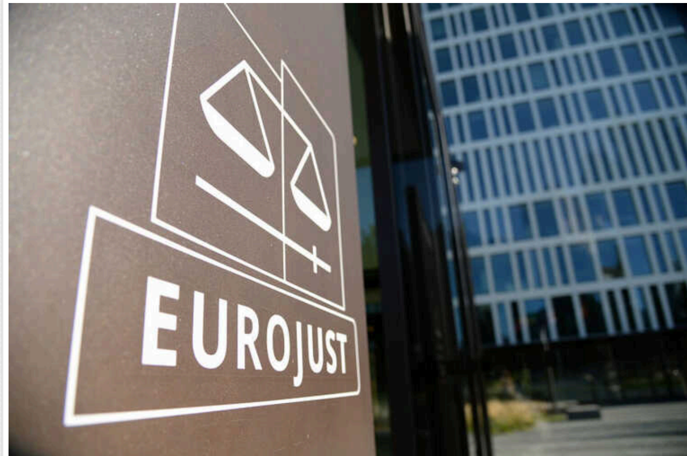
Канада та чотири країни ЄС викрили мережу, що незаконно експортувала до РФ військові товари

У результаті спільного розслідування Нідерланди, Німеччина, Латвія, Литва та Канада виявили мережу компаній, що незаконно постачали Росії обладнання для використання у військових цілях.