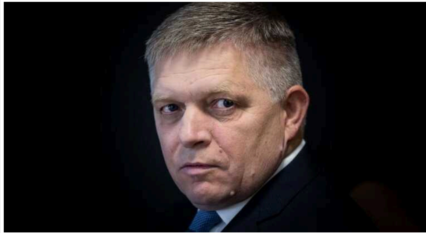
Ви серйозно думаете, що в Києві війна? Там абсолютно нормальне життя, - Прем'єр Словаччини Фіцо

Прем'єр-міністр Словаччини Роберт Фіцо напередодні свого візиту до України озвучив чергову скандальну заяву щодо обстрілів Києва, заявивши, що в столиці "немає війни, там абсолютно нормальне життя".