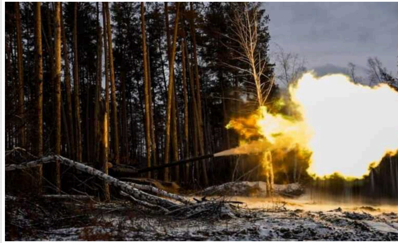
Ситуація на фронті: протягом доби ЗСУ відбили атаки на 6 напрямках, під Авдіївкою відбито 12 штурмів

Генштаб ЗСУ оприлюднив оперативну інформацію щодо російського вторгнення станом на 18.00 23 січня 2024 року.