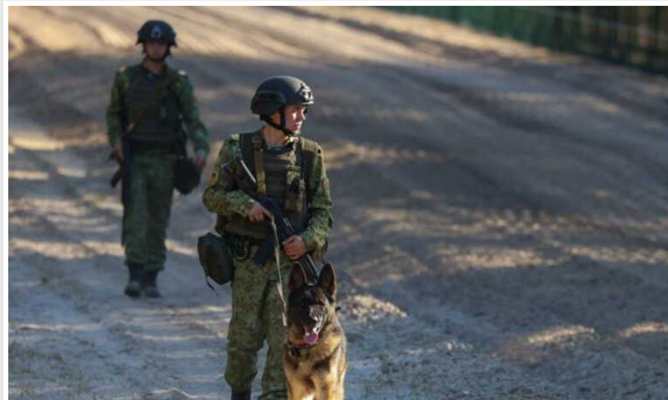
МЗС Литви відреагувало на перетин кордону країни збройними прикордонниками Білорусі

Це вже не перший випадок, коли білоруські прикордонники заходять на територію Литви. У МЗС країни просять Білорусь надати пояснення відносно цього інциденту та зробити так, аби цього більше не повторювалося.