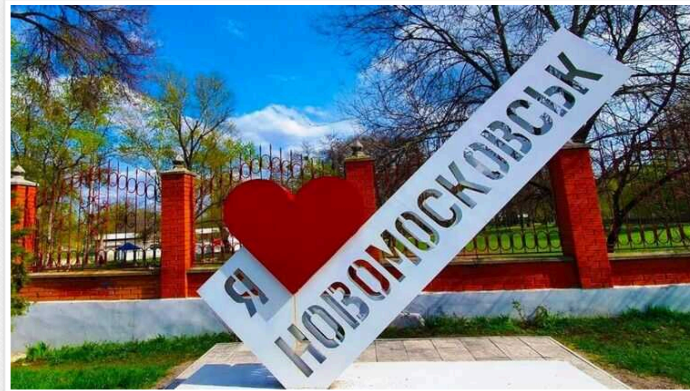
Міськрада Новомосковська на Дніпропетровщині прийняла рішення перейменувати місто на Нову Самарь

Міськрада Новомосковська Дніпропетровської області ухвалила рішення про перейменування міста на Нову Самарь. Розглядалися також варіанти Самар та Присамарськ.