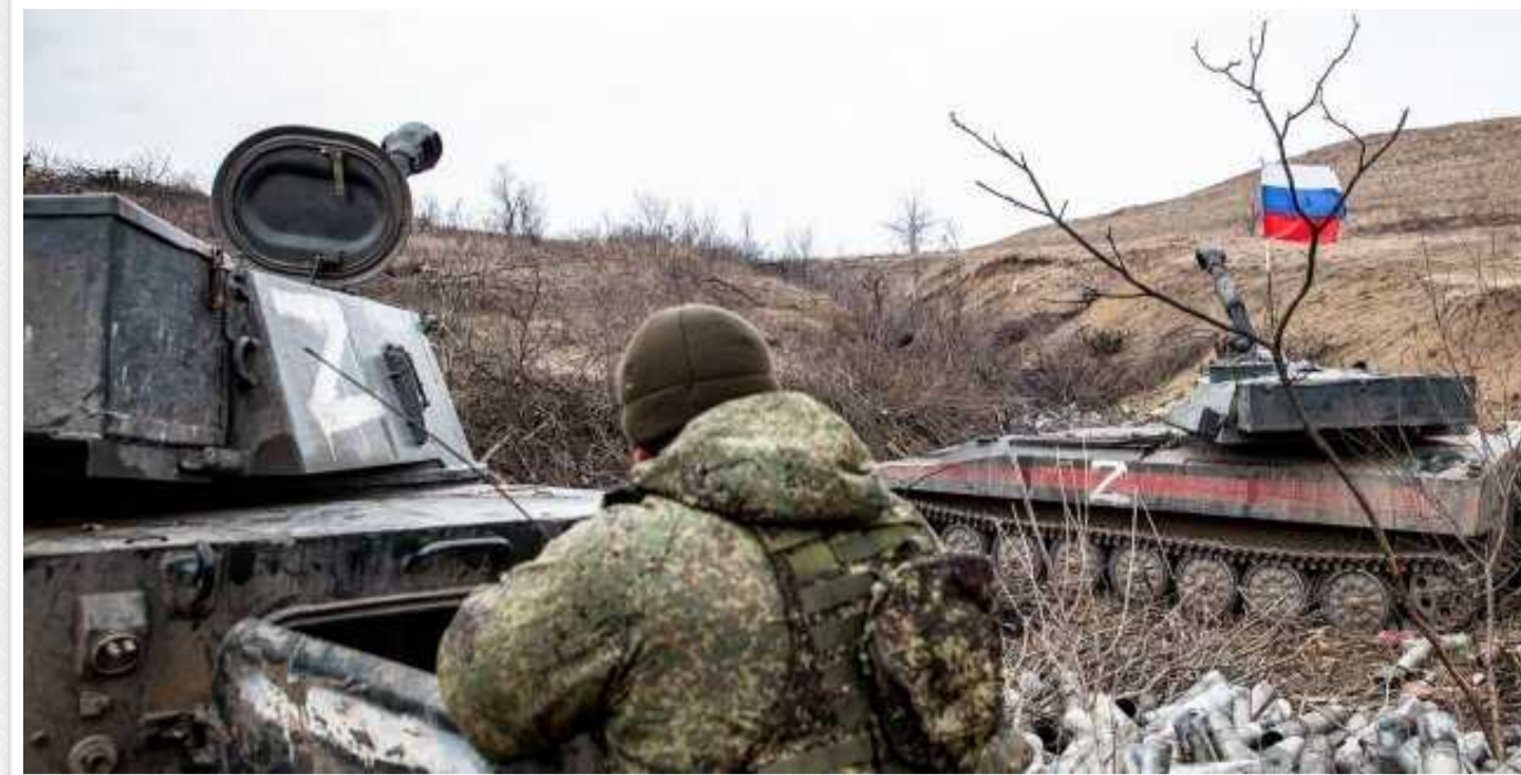
Росія жертвує 400 солдатами заради захоплення 1 квадратного км української землі, - Умеров

За приблизно два місяці російські загарбники в спробах просунутися в Україні втратили понад 54 тисячі солдатів. Кремль жертвує приблизно 400 своїми "вожаками" в обмін на 1 квадратний кілометр української землі.