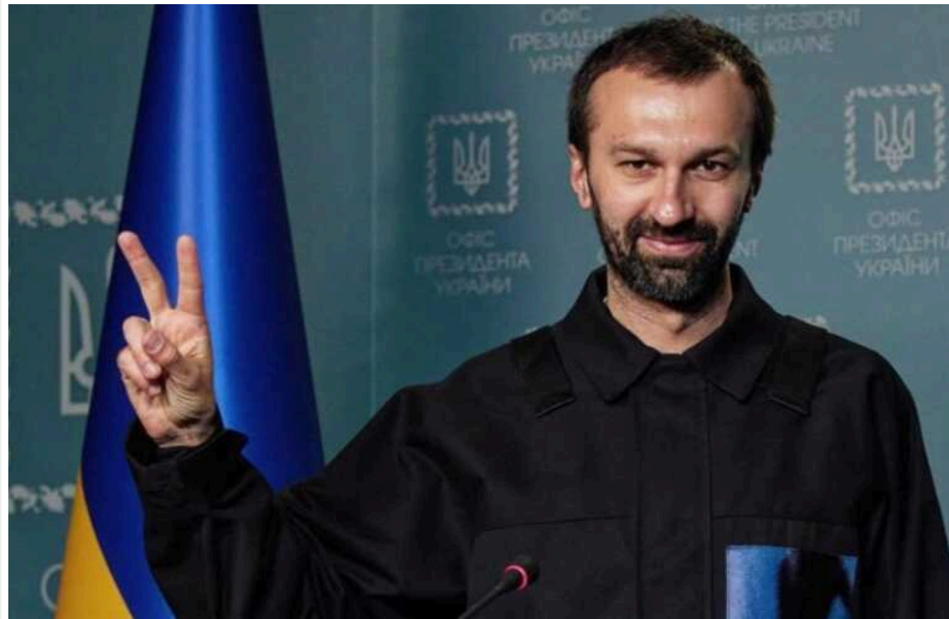
Лещенко заявив про "токсичні інтерпретації" його слів про повернення українців

Радник керівника Офісу президента подякував українцям, "які живуть, творять та платять податки" на території країни. Екснардеп звернувся й до людей, які "влаштували черговий спалах ненависті", і зазначив, що їм "ніхто дякувати не буде".